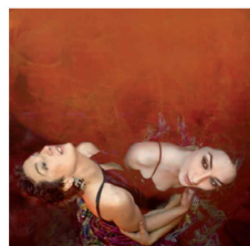
Dulce Pontes y Estrella Morente