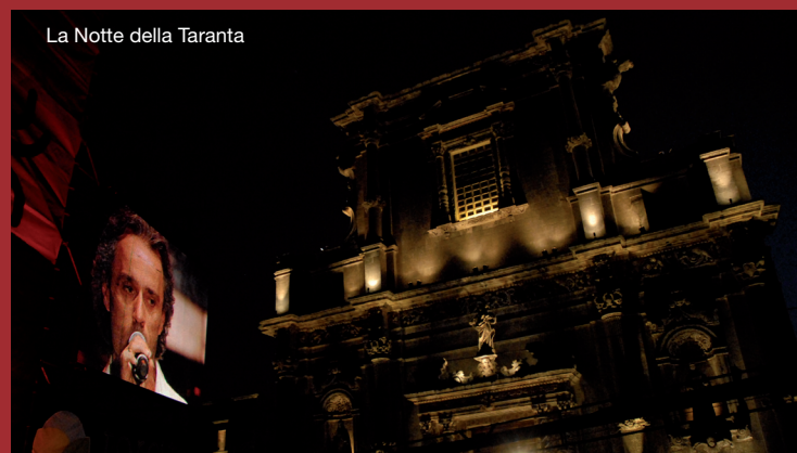
La Notte della Taranta